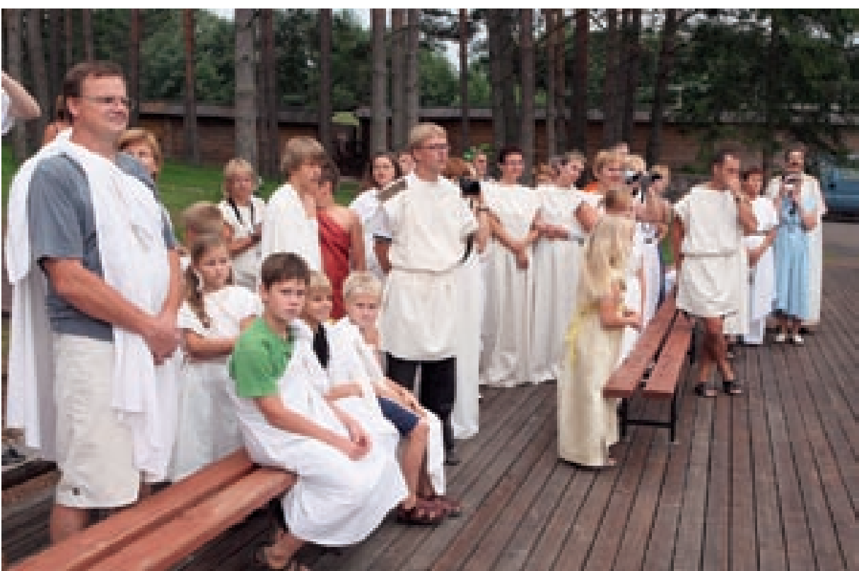
Akadeemia suvesessioonide avatseremooniad toimuvad traditsiooniliselt antiikses vaimus