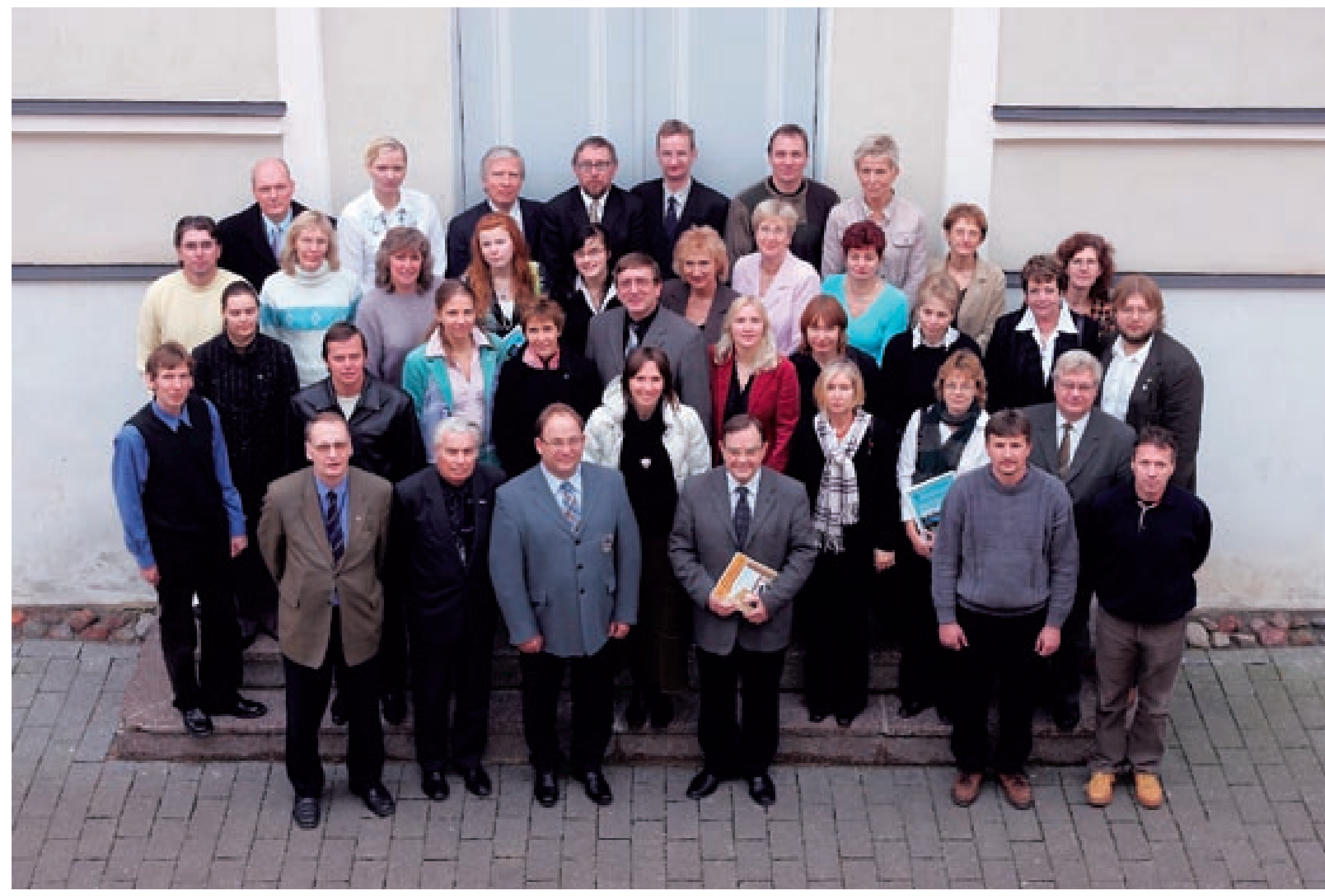
2006. aasta täiskogus osavõtjad Tartus, Eesti Spordimuseumi ees