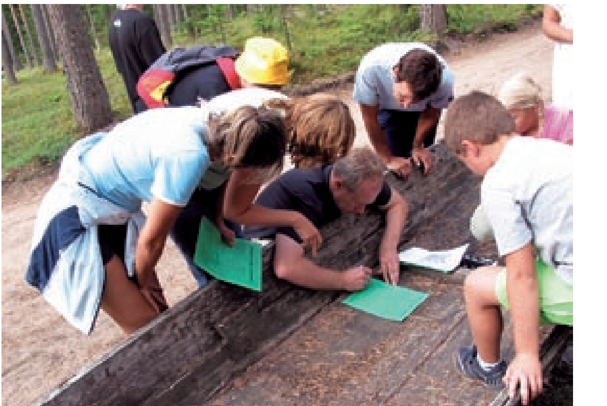
Koha ja vaimu harimine käitkies: maastikumäng 2006. aasta suvesessioonil