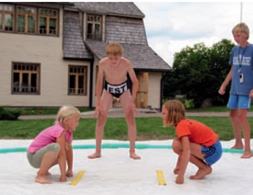
Akadeemia üritused jätkub tegevust ka nooremale. Pildil: sumokatsenud 2006. aasta suvesessioonil