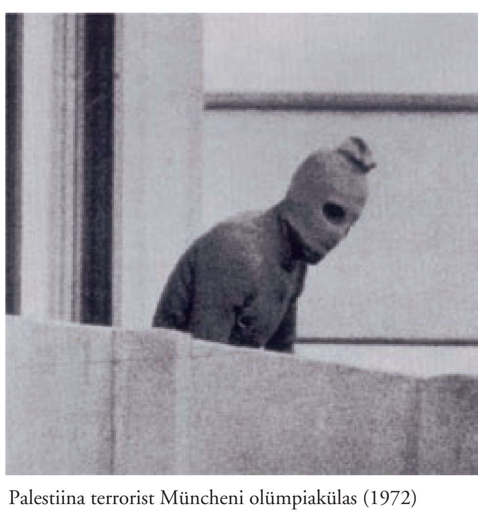
Palestiina terroristid Müncheni olümpiakülas (1972)