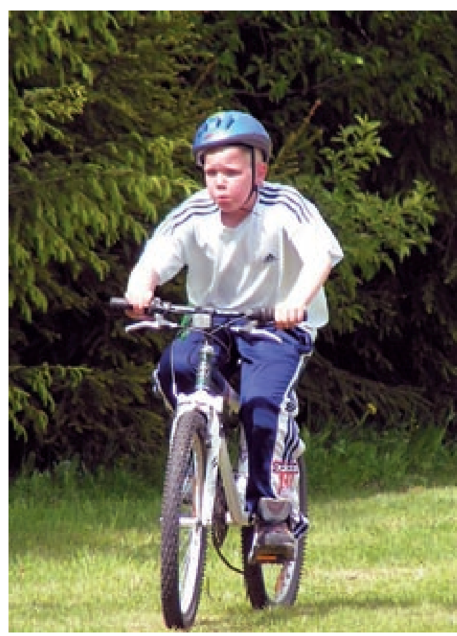
Noort spordilines annab rajal endast parima. KAS SEIDA TEED KA SINÄ?