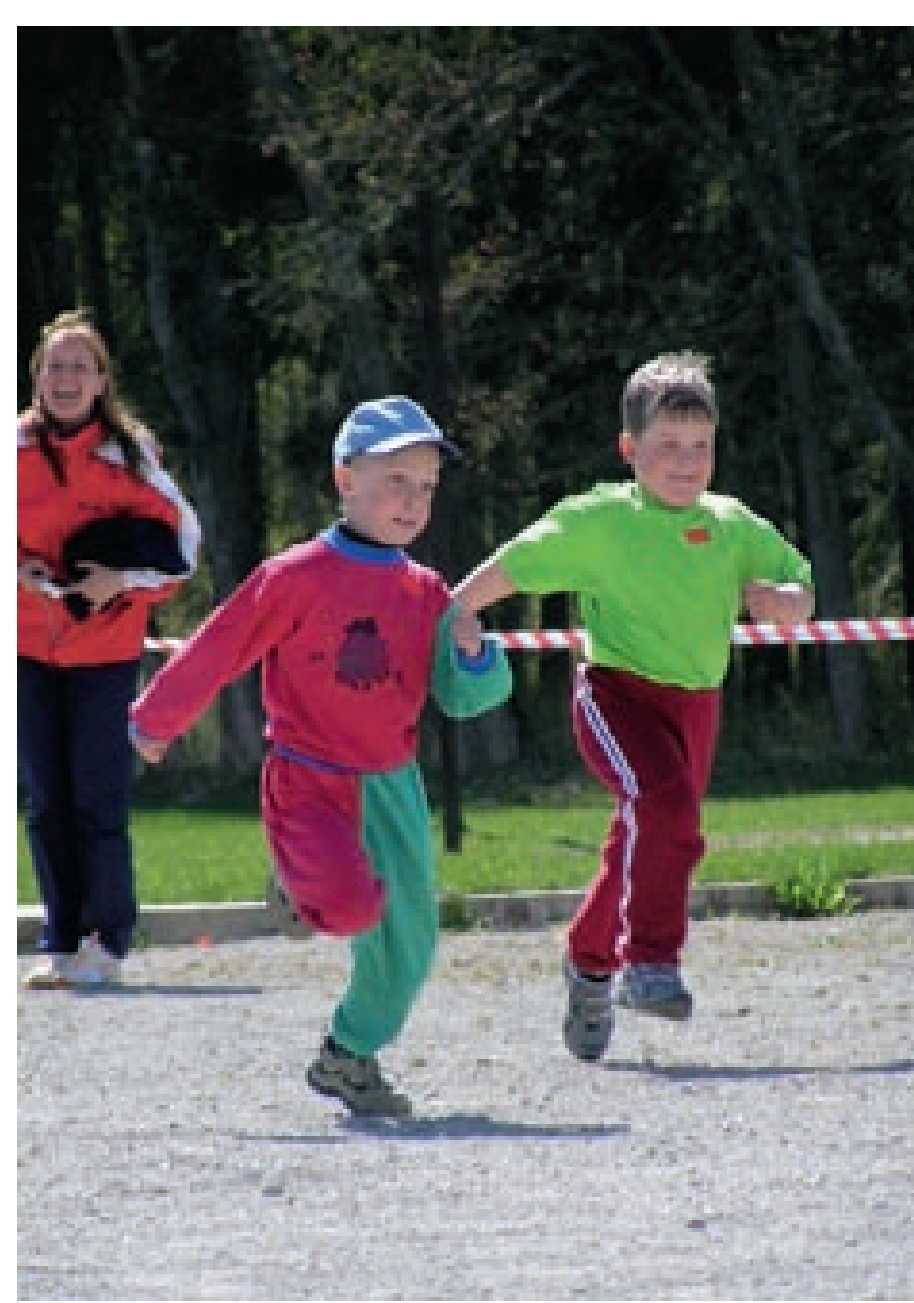
Kooliolümpiamänge suure spordis valitsevad probleemid ei olustata. Siin tumiseb sportimise rõõmu ja naudimise olümpiaunust