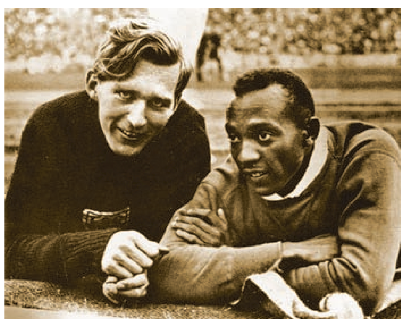
1936. aasta Berliini olümpiamängudel valitsev Hitleri propageerimise väim. Tema lemmik, Saksa kanguslippaja Lutz Lohse, ei läinud Hitleri kampaaniaga aga kaasa ja nimetas oma suure konkurent Jesse OWENST (USA), kes Longi aasas võitluses võitis. Long ja Owens said sõpradeks, pakkudes maailmale suurepärase naise aasa mängu võimalikkusest spordis