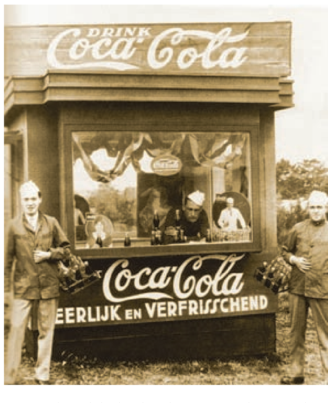
Esimene rahvusvaheline haardega olümpiasponsor oli „Coca-Cola”. Suureteotöö ajastas olümpiamängude tootamist alles Amsterdamis mängudest (1928)