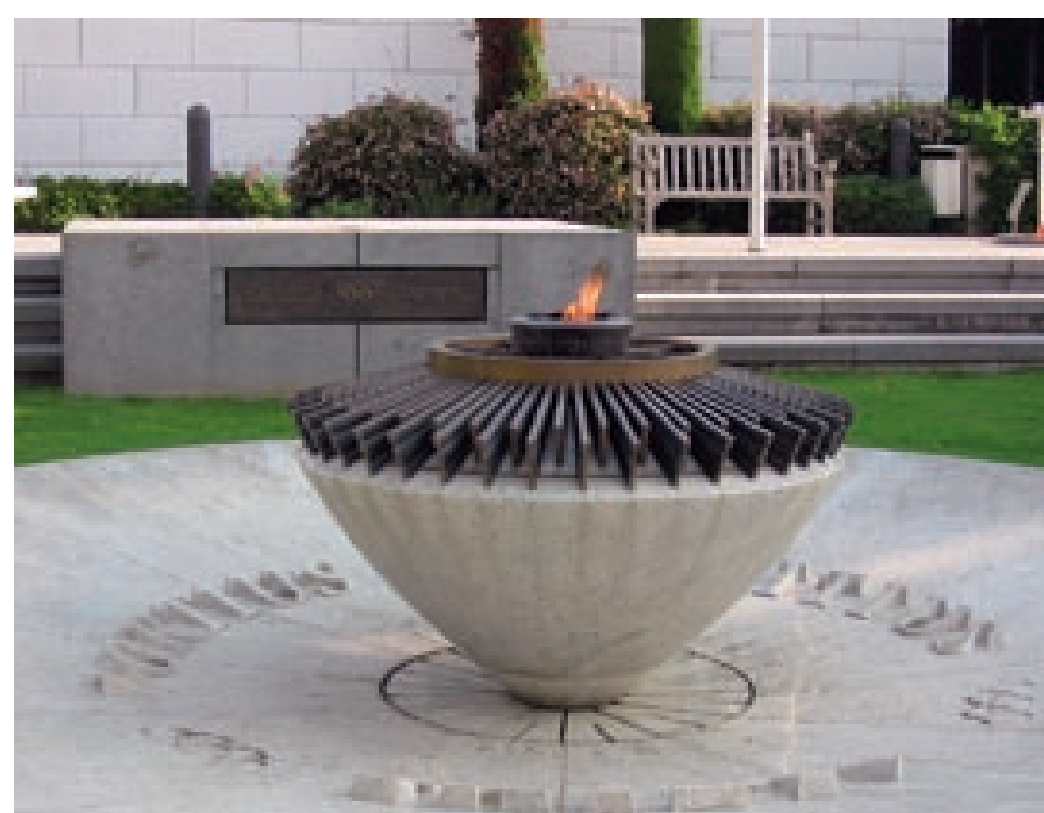
Lausanne'i olümpiamuseumi otel põlev olümpiaatni siseedab usku olümpialikumise tulevikku