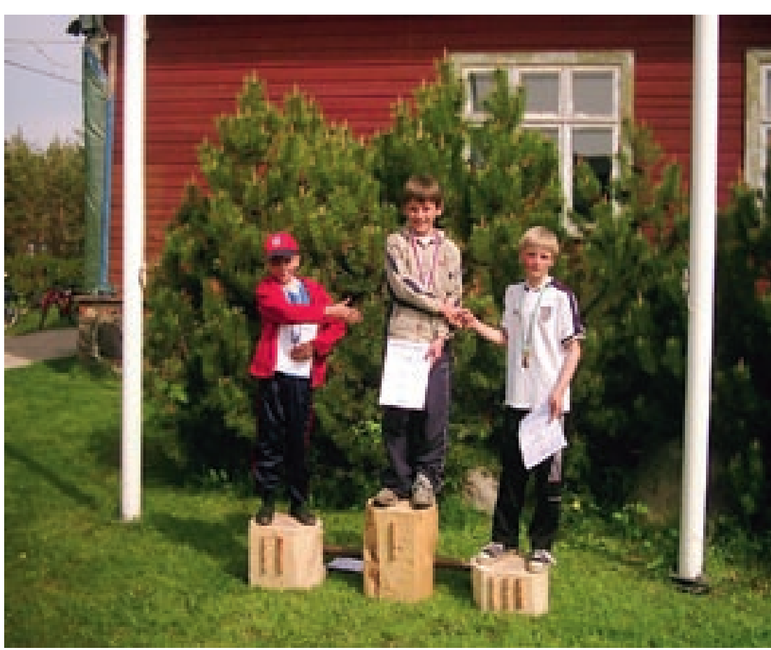
Kooliolümpiamängudel selgitatakse võitjad ainult aasas võitluses