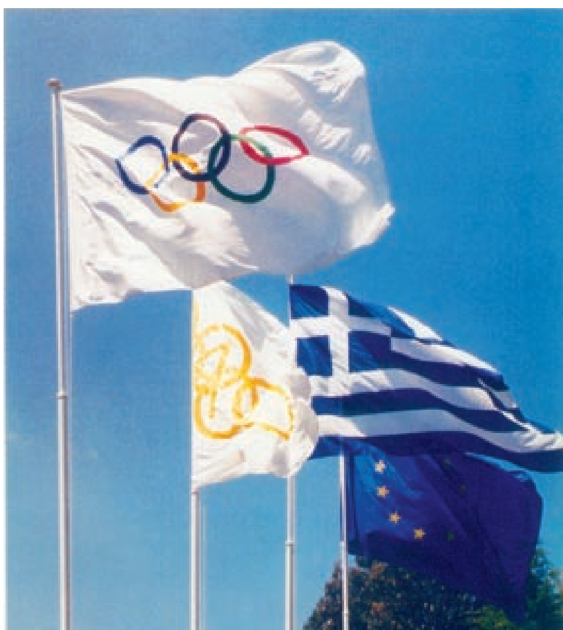
Rahvusvahelise Olümpiaakadeemia lipumastis lchvib olümpialipp

Täna on maailm hoopis midagi muud, kui see oli Pierre de Coubertini aegadel. Muutunud on ka olümpialiikumine. Leidub neid, kelle arvates polegi olümpiaideedel tänapäeva ühiskonnas enam ellujäämisvõimalust. Loodetavasti seesugused pessimistid siiski eksivad, ehkki olümpialiikumist saadab tõepoolest mitu arutlemist ja lahendust leidmist väärt probleemipundart.