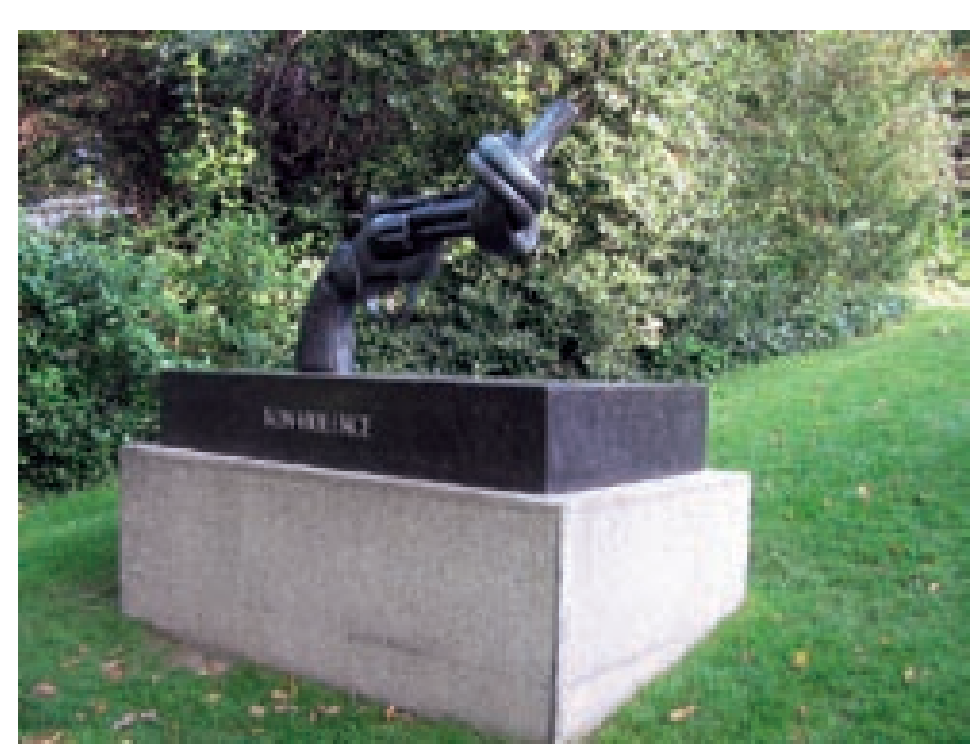
Ei vägivallale spordis! Skulptuur Lausanne'i olümpiamuseumi otel (autor Carl-Fredrik Reuterswärd)