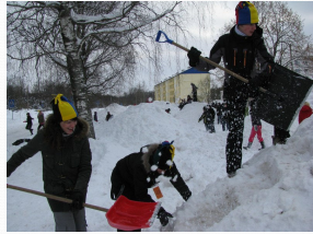
Lumelinna chitamine Paide Ühisgümnaasiumis