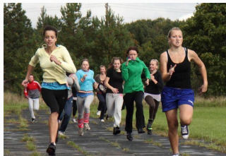
Saaremaa kodutütarde olümpiamängud