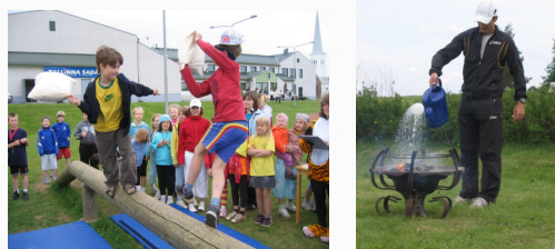
Kambja Põhikooli olümpiamängud: poomivõitlus, olümpiatule kustutamine(Timo Simonlatser)