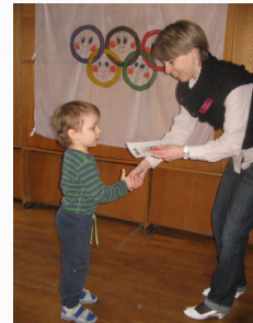
Autasustamine Tartu Helika lasteaias