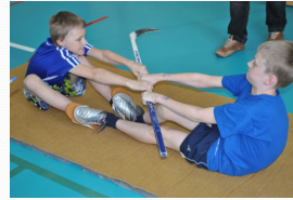
Hokikepi vägikaikavedu Taebla Gümnaasiumis