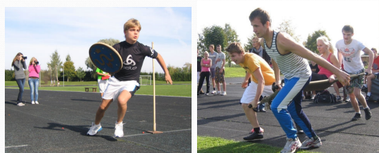
Ülenurme Gümnaasiumi olümpiamängud: kilbijooks, naisekandmine