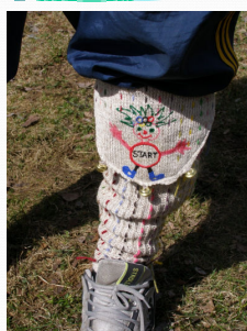
Kiigemetsa Kooli olümpiamängude maskott Leegi elusuuruses ja peakohtuniku sääristel