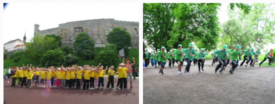
Tallinna Prantsuse Lütseumi olümpiapäev: soojendusvõimlemine, maratonijooks ümber Schnelli tiigi