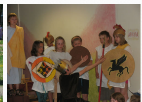
Waldorfkoolide olümpiamängud: avaparaad esotsas muusikutega ja "Iiase" etendus