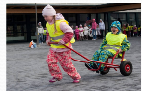
Viimsi Piilupesa lasteaias korraldasid olümpiamänge Karupoeg Puhh, Notsu, Tüger, Jänes, Kängu, Ruu, Öökull, Iiah ja siis veel suur hulk Jänese sõpru ja sugulasi