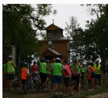
Raja vanausuliste palvela