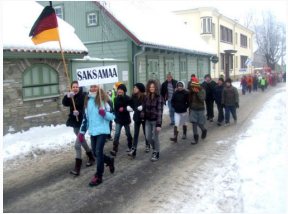
KOM avaparaad Haapsalu Linna Algkoolis