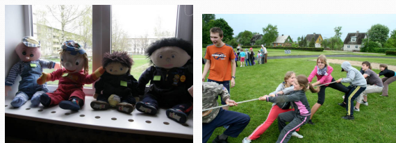
Tootsi olümpiamängud: maskott "Toots" konkurss, Teelepatsi kõievedu